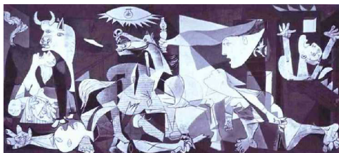
Guernica” de Pablo Picasso

Caminhar em direcção à vida com rectidão, requer uma grande coragem, uma inteligência sólida e uma imaginação visionária.